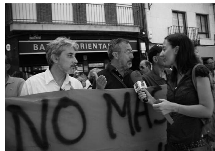
IU-LV acudió a la manifestación del 4 de agosto con la pancarta "NO MAS CIERRES. BENAVENTE SE MUERE"

IU-LV mostró su apoyo y solidaridad a l@s trabajador@s de la fábrica textil TORIO HNOS en los días que el Expediente de Regulación de Empleo (ERE) era la amenaza de cierre de la emblemática fábrica.